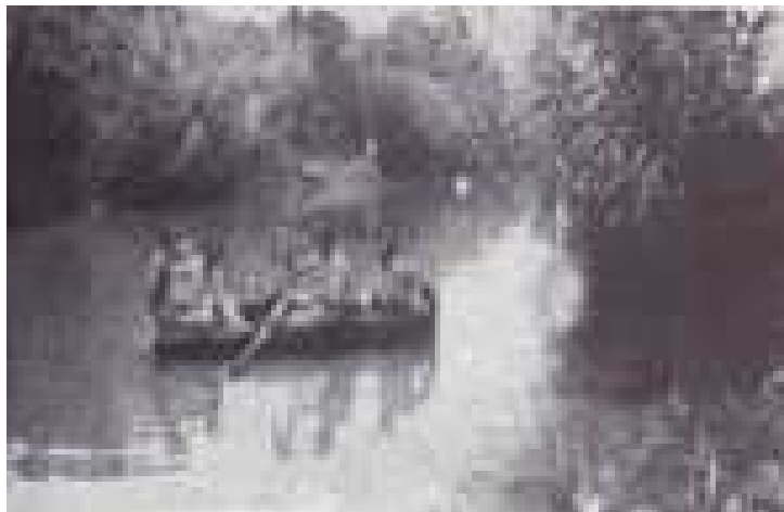
Barco existente no Pego D'Andorde, Para recreio da população nos anos de 1950

Nos antigos festejos da primavera, (hoje denominados 1º de Maio, dia do trabalhador), esse tipo de espírito da vegetação era geralmente representado junto a árvores, fontes e outros lugares sagradas e por dançarinos e dançarinas vestidos e adornados com motivos florais; folhas verdes, ramos e flores, encarnavam o espírito da vegetação, da renovação da vida depois dos meses de trevas do Inverno.